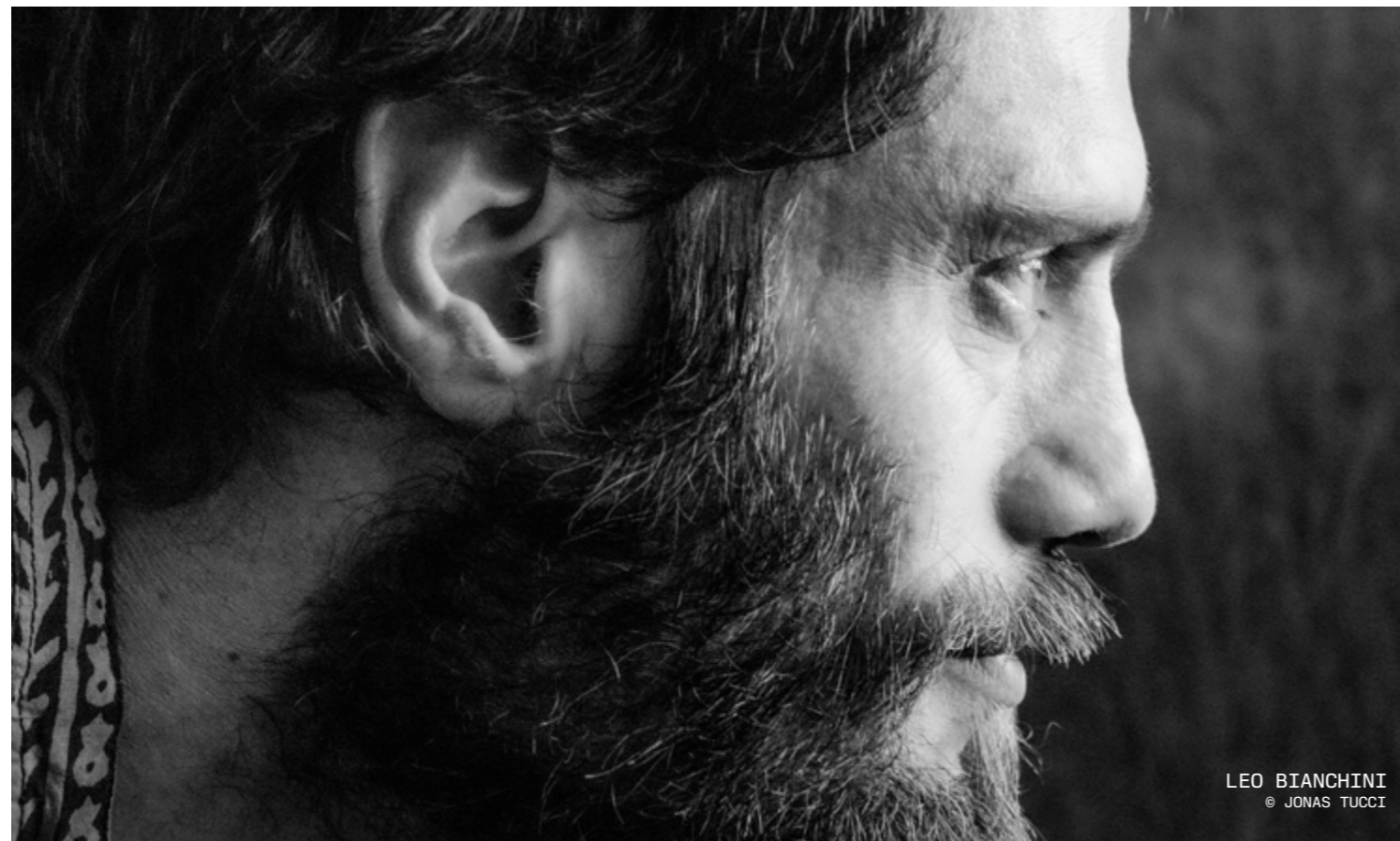
LEO BIANCHINI